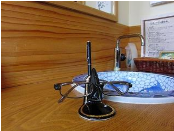
トイレや洗面台に・・・