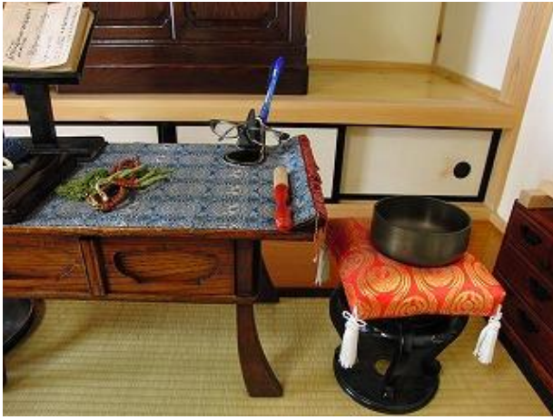
仏間のお経を読むときに・・・