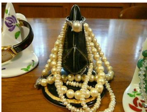
眼鏡の他にも指輪やネックレスに時計など・・・