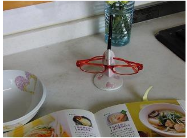
キッチンで、料理本を読むときに・・・