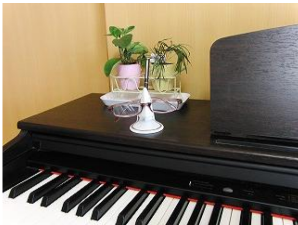
ピアノの上に・・・