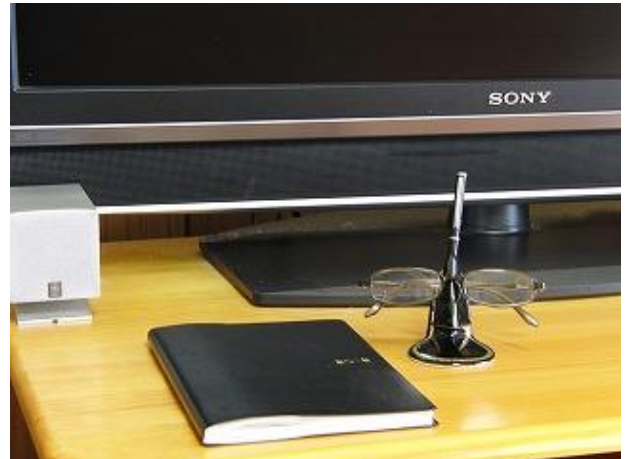
リビングのテレビの近くに・・・